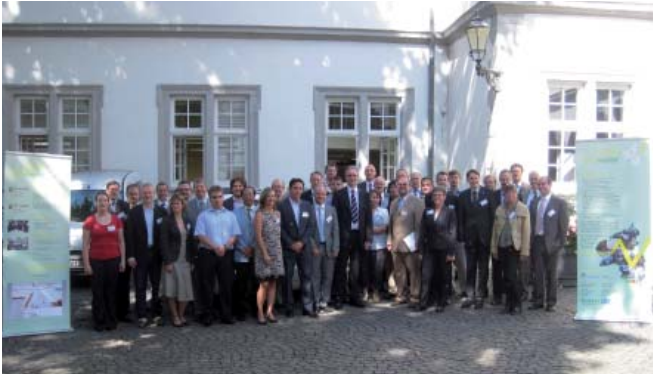
Netzwerktreffen in Koblenz, August 2011