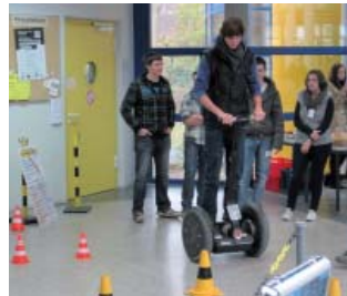
Fahren mit dem Segway

Übungen angeboten. Die praktischen Übungen hatten das Ziel, den Schülerinnen und Schülern die Breite des Themenspektrums Verkehrssicherheit näher zu bringen und sie insbesondere für die Belange der Barrierefreiheit im öffentlichen Raum zu sensibilisieren.