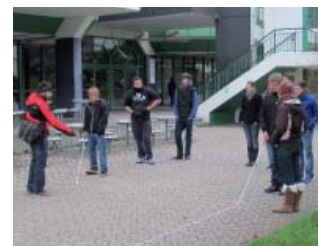
Gehen und Orientieren mit Blindenstock

Die Schülerakademie „Saturday Learning“ des Studiengangs Bauingenieurwesen bietet mit ihren drei Fachveranstaltungen und einer Exkursion einen breit gefächerten, praxisbezogenen Einblick in die Arbeit als Bauingenieurin und Bauingenieur.