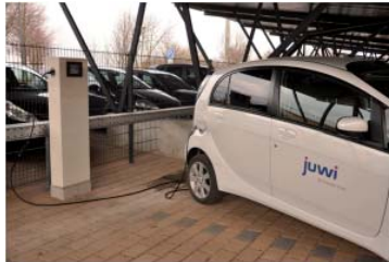
Solarcarport mit Stromparkplatz

und ländlich geprägten Kleinstädten betrachtet. Forschungspartner waren: juwi (Wörrstadt), GIP (Mainz), Frosys (Regensburg), Fraunhofer IWES (Kassel) und imove (Kaiserslautern).